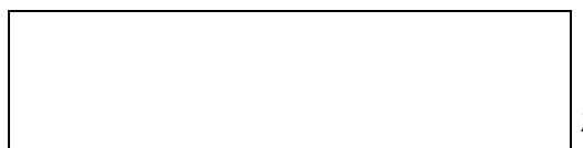
Схема границы эксплуатационной ответственности

е) локальные очистные сооружения на объекте _____ (есть/нет).